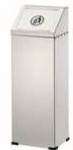
Mod. 340/80 G

Papelera Acero Inox 18/8 con tapa basculante con cubeta interior.